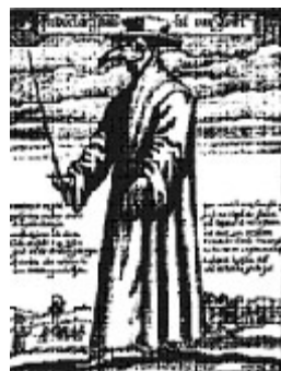
Máscara usada en el Medioevo contra la Peste

Del Judío mejor no hablar, pues piensan que del único modo que su religión es válida es si alguien le persigue constantemente: es la única religión que se fortalece de sus propias desgracias. El número de religiones que claman el tener “la verdad” es indescriptible e innumerable, pero los fanáticos que las sostienen pueden verse cotidianamente, o bien en la calle, o bien por el televisor. Entre diferencias, desdichas y críticas la Masonería se ha convertido en un sustituto de la religión para muchas personas, y muchas jurisdicciones han comenzado a tomar la “regularidad” e “irregularidad” como una especie de bandera de identidad. Se ha formado una especie, a su vez, de “papado masónico”