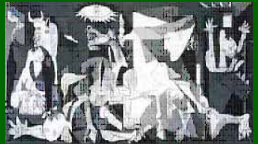
La violencia solo engendra más violencia

Siram Abif , más que un mito o leyenda, es un paradigma de genialidad, perseverancia, racionalidad y humanismo, que debería ser un ejemplo a seguir, no una exaltación al mito o leyenda, ni culto a la personalidad.