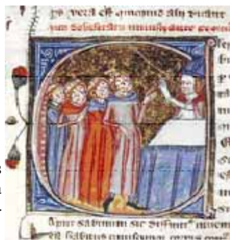
Imagen de unos monjes disfigurados tras sufrir la plaga bubónica. Manuscrito del siglo XIV.

Era pues, la rata la responsable de todo este desajuste, la rata que transportaba una maldita pulga que, a su vez, pica al hombre, o simplemente el hombre respira el ambiente contaminado, es decir, el aire donde esta plaga existe: de ahí el termino “peste.”